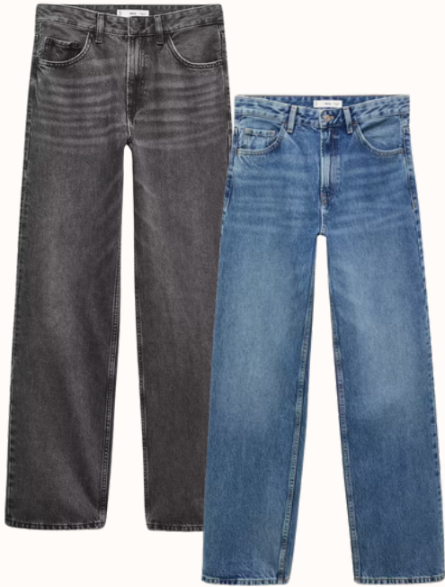
MANGO : Jean droit taille haute 39,99€