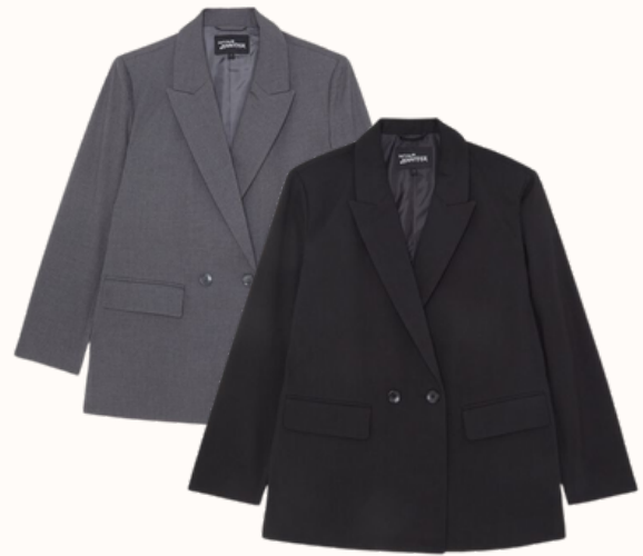
Jennyfer : Veste blazer 29,99€