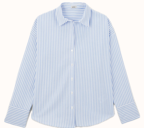
Pimkie : Chemise oversize rayée col ouvert 19,99 €