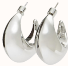
Stradivarius : Boucles d'oreilles anneaux 9,99 €