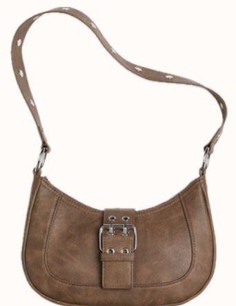
H&M : Sac bandoulière enduit 19,99 €