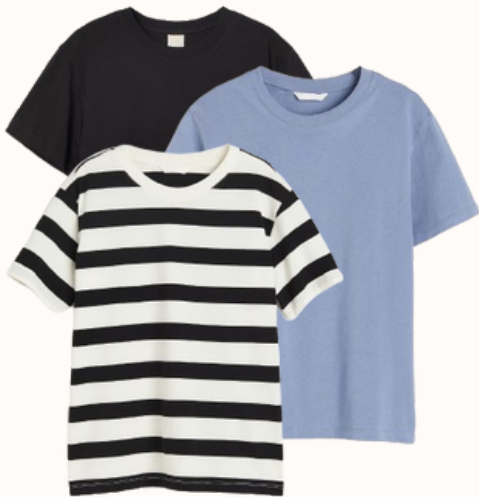
H&M : T-shirt en coton 7,99 €