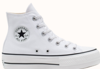
Converse : Chuck Taylor All Star Platform 90,00 €