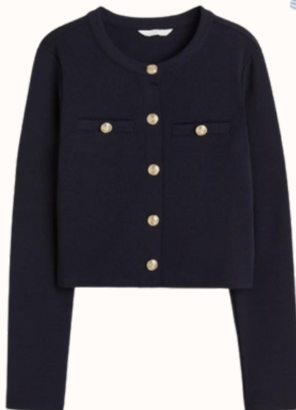
H&M : Gilet texturé 19,99 €